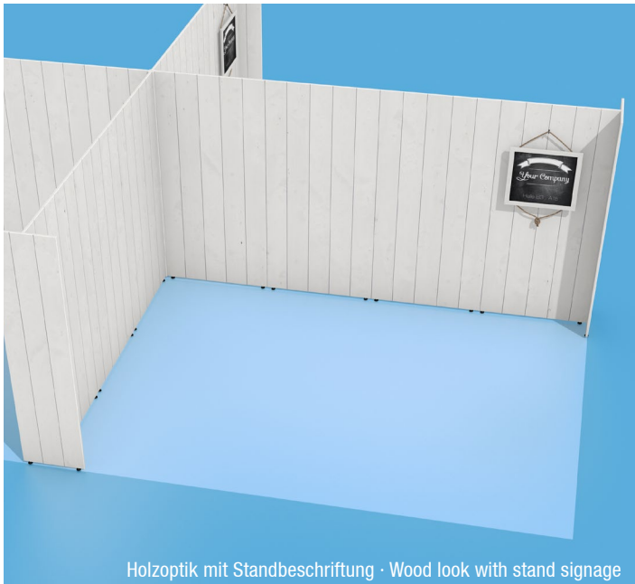
Holzoptik mit Standbeschriftung · Wood look with stand signage