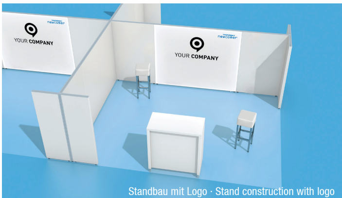
Standbau mit Logo · Stand construction with logo